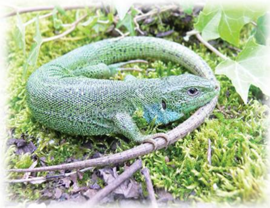
Ящерица средняя ( Lacerta media )

Заповедники созданы для того, чтобы охранять и изучать дикую природу.