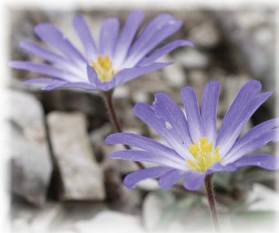
Ветреница нежная ( Anemone blanda )

Дикорастущие растения быстро погибнут и не дадут семян, если ты их сорвешь.