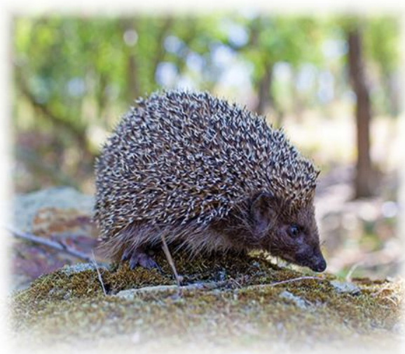
Ёж обыкновенный ( Erinaceus europaeus )